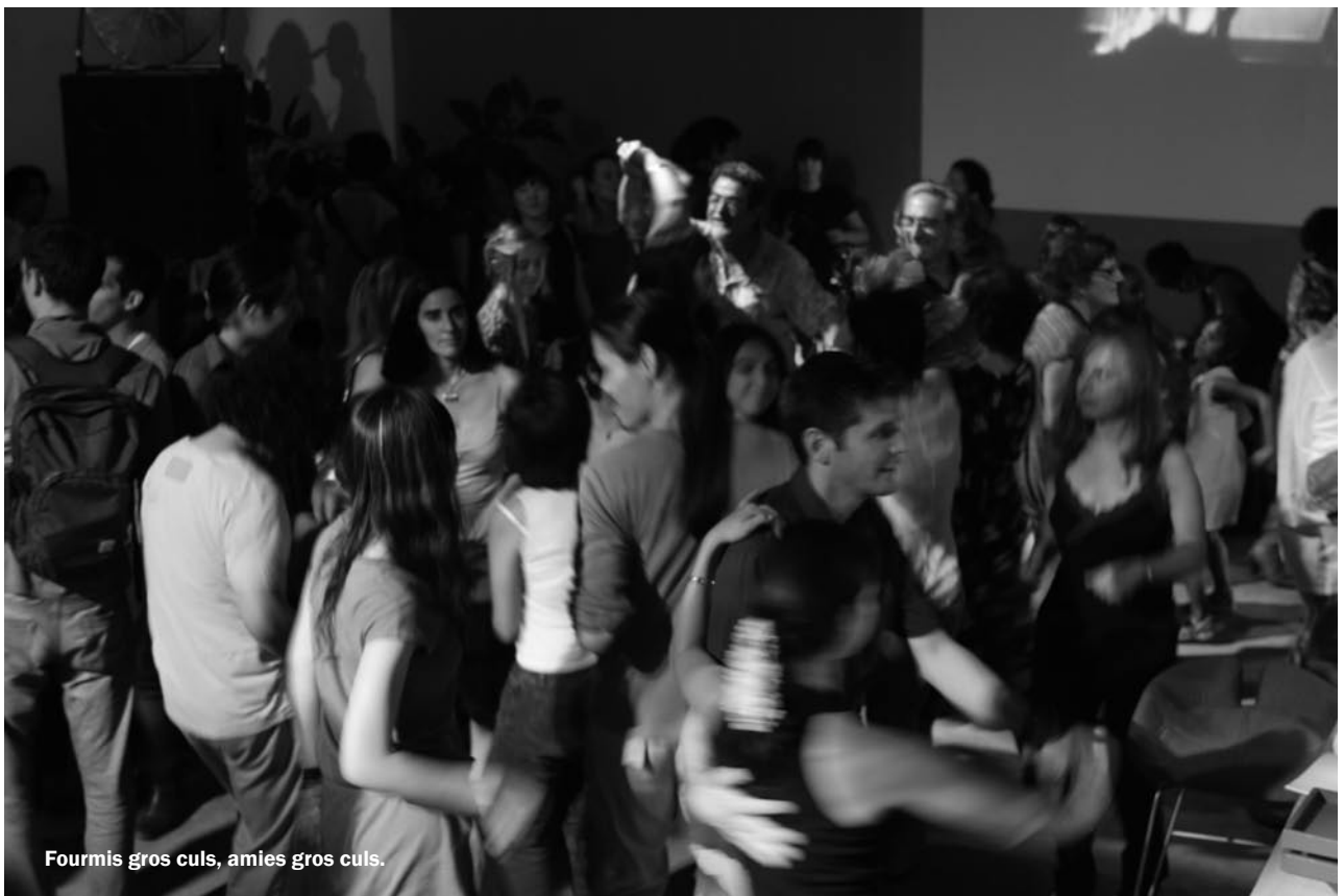
Fourmis gros culs, amies gros culs.