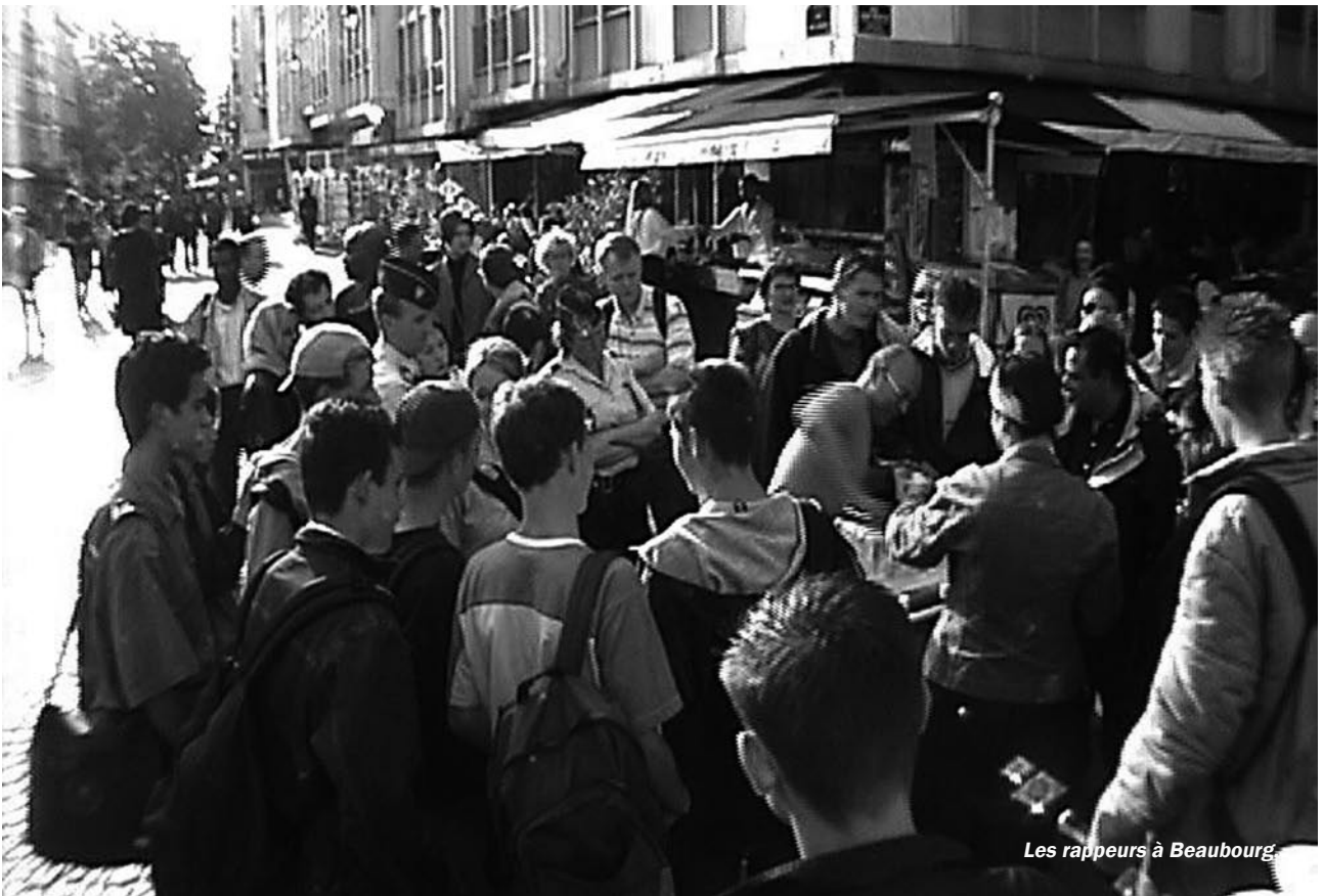
Les rappers à Beaubourg