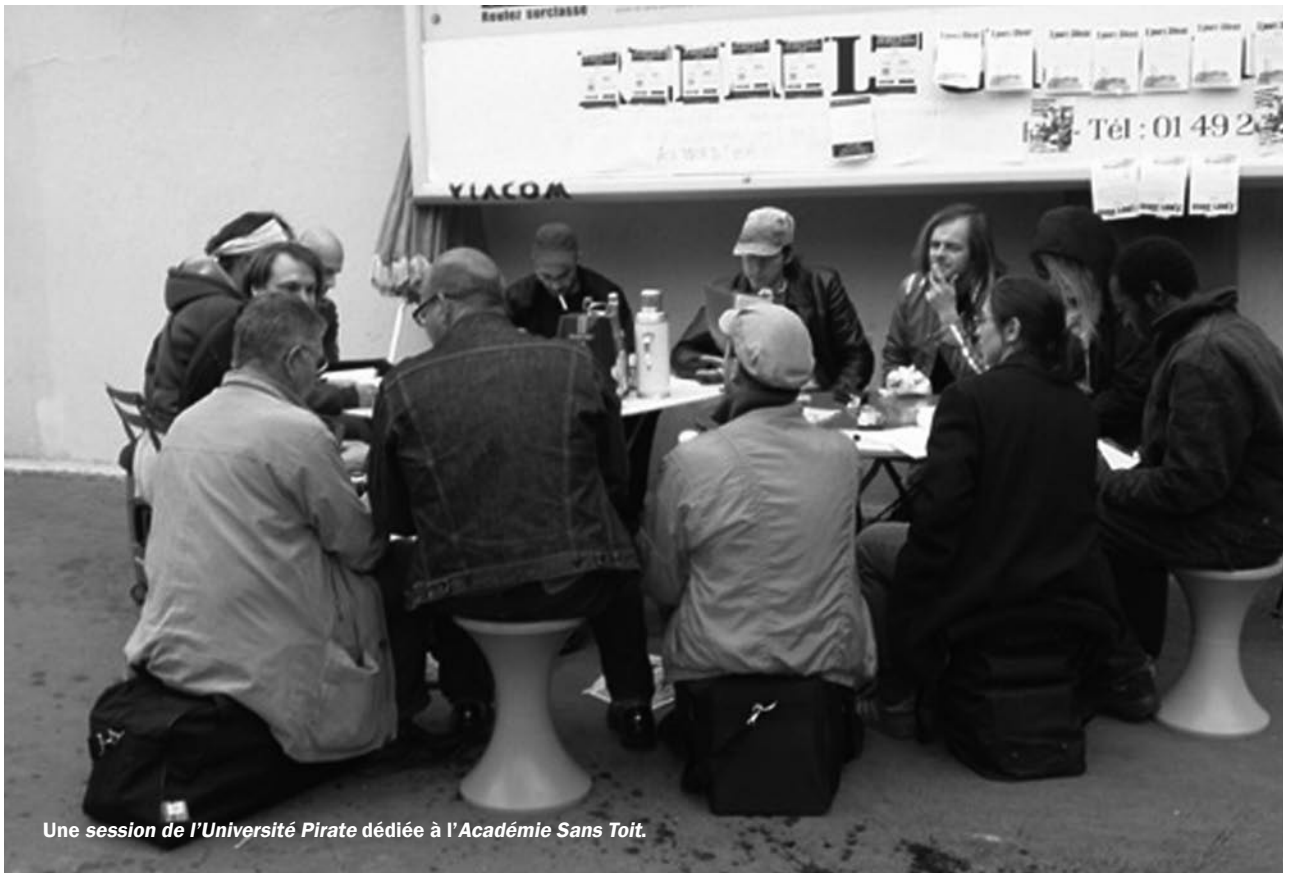
Une session de l'Université Pirate dédiée à l'Académie Sans Toit.