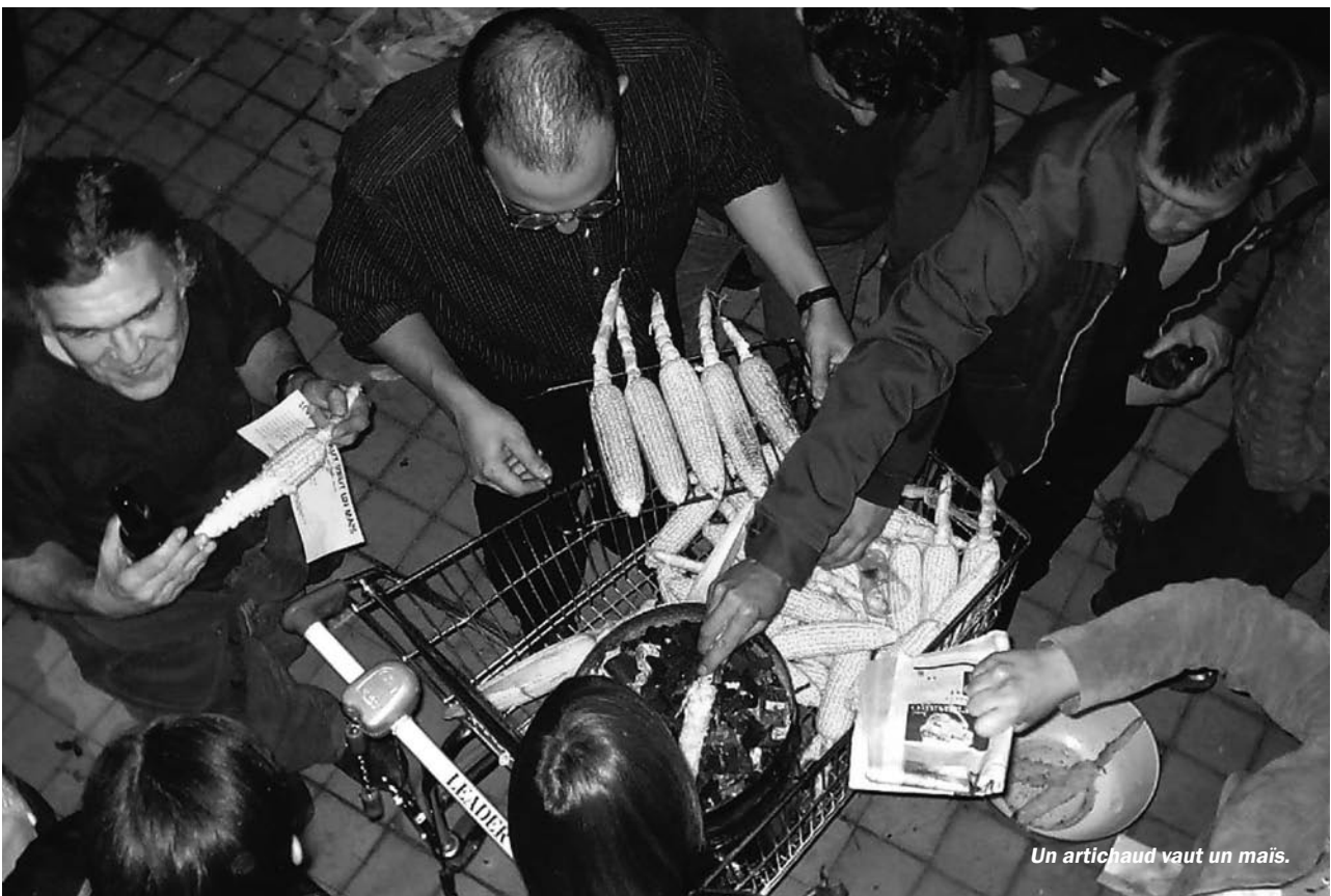
Un artichaud vaut un maïs.