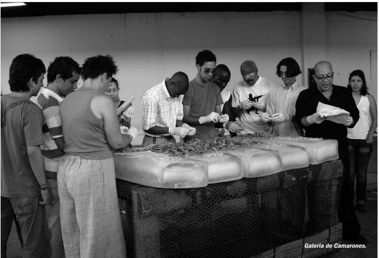
Galeria de Camarones.